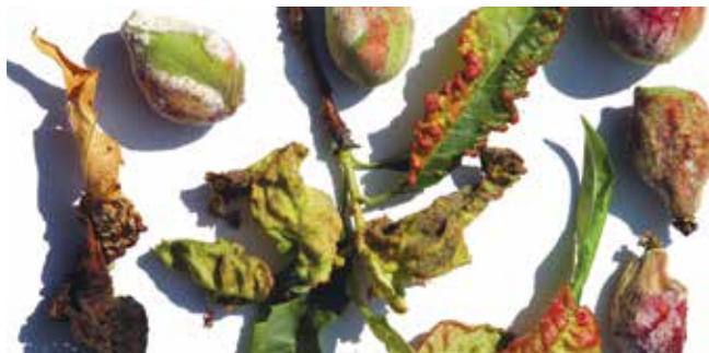
Breskova kodravost ( Taphrina deformans )

Prvo škropljenje breskev in ostalih koščičarjev opravimo s pripravkoma Cuprablau Z 35 WP v odmerku 3 kg/ha ali Cuprablau Z ultra v odmerku 1,8 kg/ha (pri porabi vode 350 – 700 L/ha), ko se pričnejo odpirati konice luskolistov . Istočasno pripravka Cuprablau Z 35 WP ali Cuprablau Z ultra zatirata tudi glivo, ki povzroča listno luknjičavost koščičarjev ( Stigmia carpophila ).