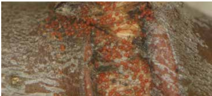
Zimska jajčeca rdeče sadne pršice