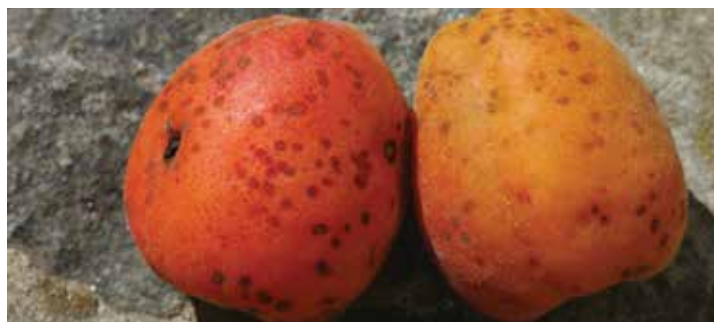
Listna luknjičavost koščičarjev ( Clasterosporium carpophilum )