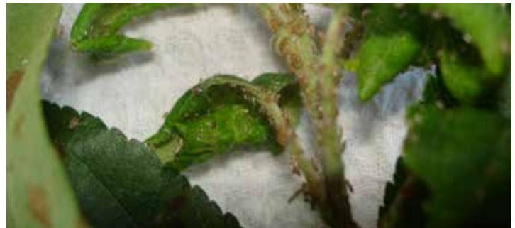
Jablanova mokasta uš ( Dysaphis plantaginea )

Uporaba v kulturah: hruška ( Pyrus L. ); jabolana ( Malus MILL. ); koščičasto sadno drevje (koščičarji)