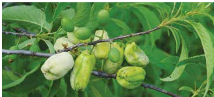
Rožičavost češpelj ( Taphrina pruni )