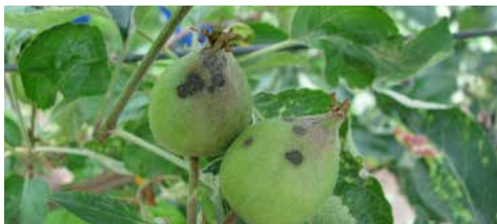
Jablanov škrlup ( Venturia inaequalis )