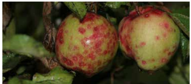
Kaparji ( Coccina )