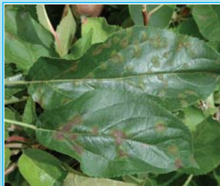
Jablanov škrlup-močna okužba