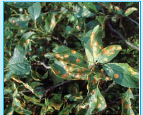
Češpljeva rdeča listna pegavost