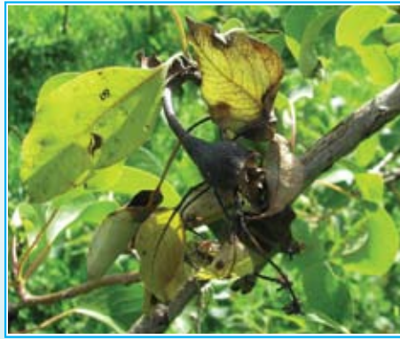
Bakterija Erwinia amylovora -hrušev ožig