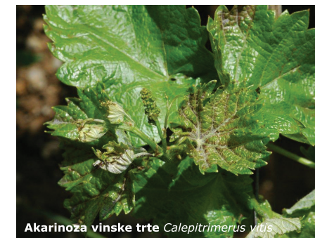
Akarinoza vinske trte Calepitrimerus vitis