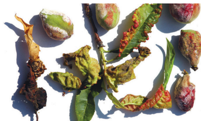
Breskova kodravost Taphrina deformans

Koščičasto sadje je priporočljivo poškropiti v zadnji dekadi februarja, najkasneje v začetku meseca marca, pred prvimi obilnimi padavinami. Glive iz rodu Taphrina povzročajo bolezen breskovo kodravost Taphrina deformans , ki brste okuži takoj, ko se le ti pričnejo odpirati, pogosto se srečamo tudi z rožičavostjo češpelj Taphrina pruni .