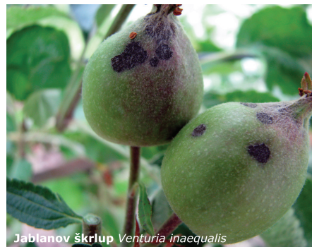
Jablanov škrlup Venturia inaequalis

okužb uporabite pripravka Cuprablau Z 35 WP v odmerku 3 kg/ha, (30g/10 l) vode ali Cuprablau Z 35 WG v odmerku 1,6 - 2,1 kg/ha, (20g/10 l vode). Priporoča se škropljenje v fenološki fazi mišjega ušesa (BBCH 54-59).