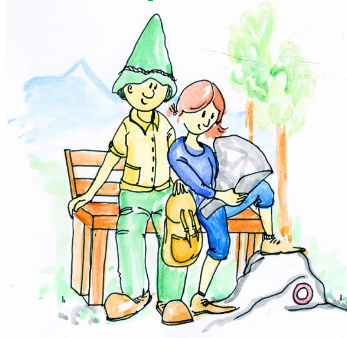
Natečaj Cinkarne Celje 2013/14